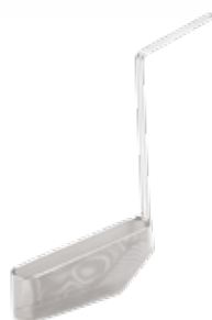
Zásobník na usazeniny