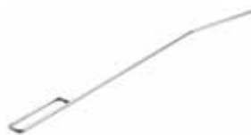
Kartáč na čištění ventilu