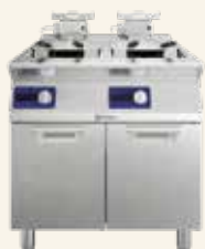
OptiOil Fritézy HP

Od plně automatizovaných systémů s maximálním výkonem až po kompaktní fritézy na pracovní desku – kompletní portfolio navržené pro potřeby každé profesionální kuchyně.