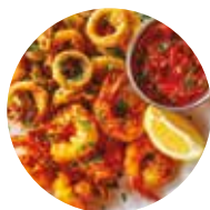
Ingredience obalené v mouce