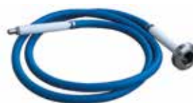
Produžetak s pumpom za ispuštanje ulja