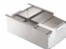
Sustavi za filtriranje ulja