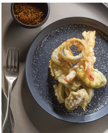
Tempura de légumes avec le Wok LiberoPro