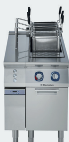
1. XP700 Cuiseur à pâtes