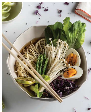
Ramen aux légumes