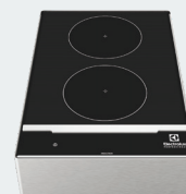
3. LiberoPro Induction Double Zone