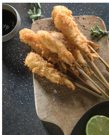
Crevettes panées avec le Wok LiberoPro