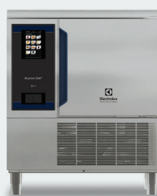
2. SkyLine Chill S Cellule de refroidissement 30 kg