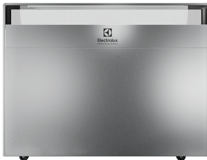
Version standard en acier inoxydable de haute qualité (AISI 304)

Choisissez parmi six finitions différentes* et adaptez votre solution à vos besoins. Ajoutez une touche de personnalité et d'élégance !