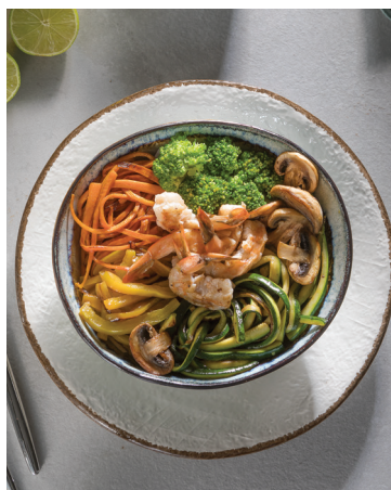
Crevettes et légumes