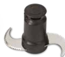
Jemně zoubkovaný nožový blok (součást balení)