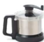
Nádoba 2,6 l z nerezové oceli AISI 304