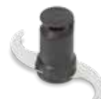
Hladký nožový blok