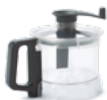
Nádoba 2,6 l z průhledného kopolyesteru

Vytvářejte bohaté a rozmanité menu pomocí sady volitelného příslušenství.