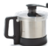
Nádoba 3,6 l z nerezové oceli AISI 304