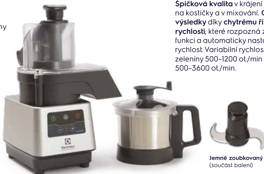
Jemně zoubkovaný nožový blok (součást balení)

Špičková kvalita v krájení na plátky, na kostičky a v mixování. Optimální výsledky díky chytrému řízení rychlosti , které rozpozná zvolenou funkci a automaticky nastaví vhodnou rychlost. Variabilní rychlost kráječe zeleniny 500-1200 ot./min a kutr/mixér 500-3600 ot./min.