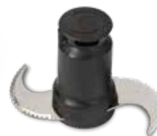
Rotor oštrice s mikrozupcima (uključen)