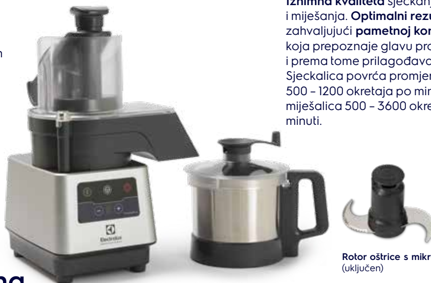
Rotor oštrice s mikrozupcima (uključen)

Preko 75 godina iskustva u dizajniranju visokoučinkovitih rješenja za pripremu hrane.