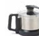
Bol de 2,6 litres en acier inoxydable AISI 304