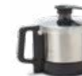
Bol de 3,6 litres en acier inoxydable AISI 304