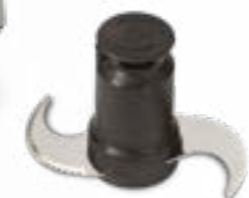
Rotor à lames micro-dentées (inclus)