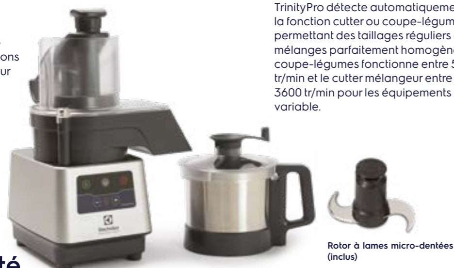
Rotor à lames micro-dentées (inclus)

Plus de 75 ans d'expérience dans la conception de solutions hautement performantes pour la préparation culinaire.