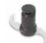
Rotor à pales lisses