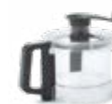
Bol de 2,6 litres En copolyester transparent

TrinityPro s'adapte à vos différents besoins grâce à un grand choix d'accessoires. (en option)