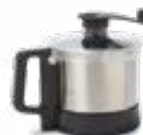
3,6 lt kom in AISI 304 RVS