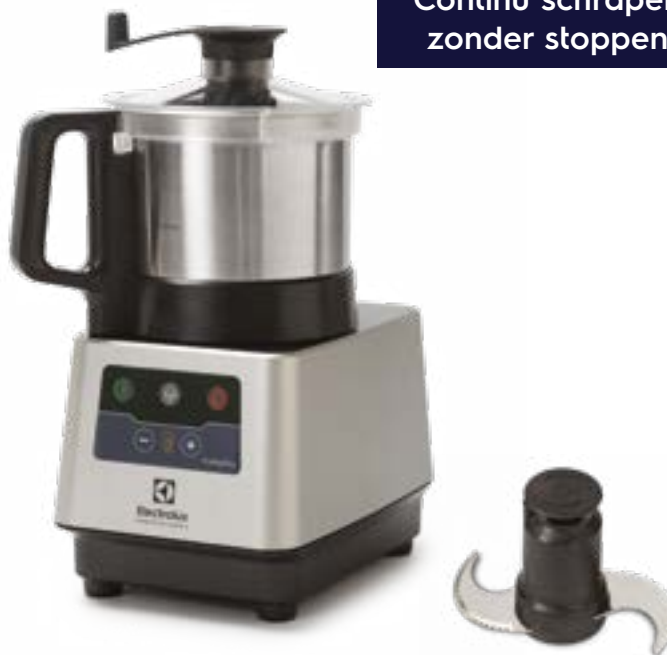
Microtand mes (inbegrepen)