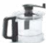
2,6 lt kom in transparant copolyester

Bereid meerdere menuvariaties met de optionele accessoires.