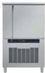
80/40 kg - 10 GN 2/1 Vnější rozměry (šxhxv) 1000x955x1645 mm El. příkon - 3.96 kW