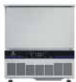
25/15 kg - 5 GN 1/1 Vnější rozměry (šxhxv) 762x708x850 mm El. příkon - 1.58 kW