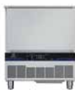
25/15 kg - 5 GN 1/1 Vnější rozměry (šxhxv) 762x760x902 mm El. příkon - 1.58 kW