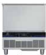
15/5 kg - 5 GN 1/1 Vnější rozměry (šxhxv) 762x760x902 mm El. příkon - 0.73 kW

Naše řada šokových zchlazovačů/zmrazovačů nabízí maximální jistotu a dlouhou životnost. Díky své vysoké odolnosti se můžete spolehnout, že vaše investice jistě vydrží po mnoho let. Je tudíž vynikající volbou pro ty, kteří hledají spolehlivé, cenově výhodné a dlouhodobé řešení.