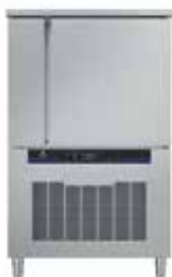
80/40 kg - 10 GN 2/1 Külső méretek (sz × m × h) 1000x955x1645 mm Elektromos teljesítmény - 3,96 kW