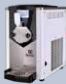
Fagylaltgép A kicsi, csendes, teljesítőképes krémfagylalt adagolókkal vállalkozása virágozni fog