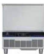
25/15 kg - 5 GN 1/1 Külső méretek (sz × m × h) 762x760x902 mm Elektromos teljesítmény - 1,58 kW