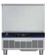
15/5 kg - 5 GN 1/1 Külső méretek (sz × m × h) 762x760x902 mm Elektromos teljesítmény - 0,73 kW

A gyorsfűtő-fagyasztó termékcsaládunk nagy teherbírást és hosszú élettartamot kínál. Nagy tartósságának köszönhetően bízhat abban, hogy beruházása évekig kitart, így kiváló választás azok számára, akik megbízható, ár-érték arányú, időtálló megoldást keresnek.