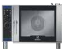
6 GN1/1 Külső méretek (sz × m × h) 860 × 766 × 633 mm Elektromos teljesítmény – 7,7 kW Gázteljesítmény – 8,5 kW + 0,35 kW (elektromos)

Keresztálcás légkeveréses sütőink választéka hatékony sütést és ízletes, konzisztens állagú ételeket kínál ügyfeleinknek. Kiváló ár-érték arányú termékpalaánk tökéletes befektetés minden olyan vendéglátó intézmény számára, amely optimalizálni szeretné a működését.