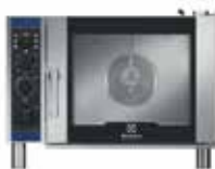
6 GN1/1 Smart Steam változat Külső méretek (sz × m × h) 860 × 766 × 633 mm Elektromos teljesítmény – 7,7 kW