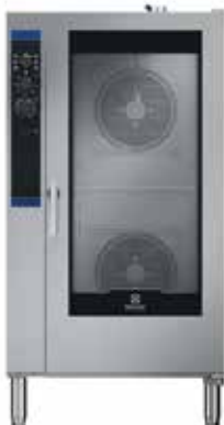
20 GN1/1 Külső méretek (sz × m × h) 890 × 915 × 1750 mm Elektromos teljesítmény – 34,5 kW Gázteljesítmény – 35 kW + 0,5 kW (elektromos)