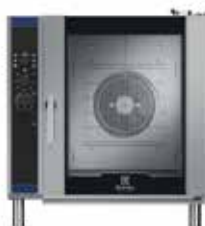
10 GN1/1 Külső méretek (sz × m × h) 890 × 910 × 950 mm Elektromos teljesítmény – 17,3 kW Gázteljesítmény – 18,5 kW + 0,35 (elektromos)