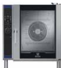
10 GN2/1 Külső méretek (sz × m × h) 890 × 1225 × 950 mm Elektromos teljesítmény – 24,5 kW Gázteljesítmény – 25 kW + 0,5 kW (elektromos)