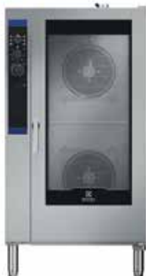
20 GN2/1 Külső méretek (sz × m × h) 890 × 1230 × 1750 mm Elektromos teljesítmény – 48,9 kW Gázteljesítmény – 50 kW + 1 kW (elektromos)