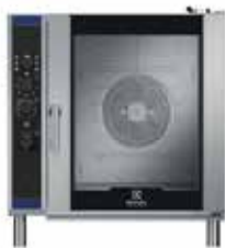
10 GN1/1 Smart Steam változat Külső méretek (sz × m × h) 890 × 910 × 950 mm Elektromos teljesítmény – 17,3 kW