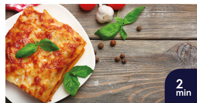
Geregenereerde lasagna Klaar in 2 min