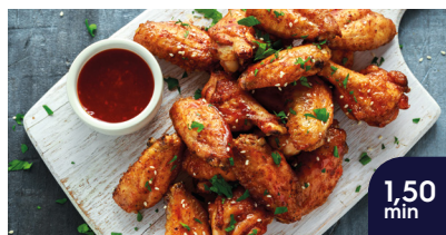
Geregenereerde kippenvleugels Klaar in 1,50 min

Bereid een breed gamma aan verse en diepgevroren pr