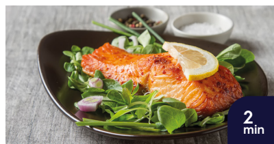
Verse zalmfilet Klaar in 2 min