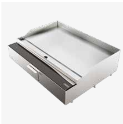
Fry top XL