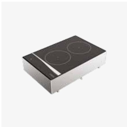
Piano di cottura a induzione a due zone