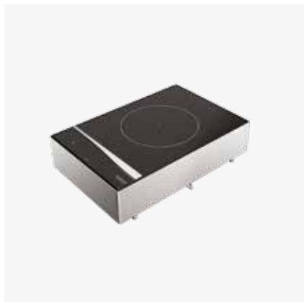
Piano di cottura a induzione monozona