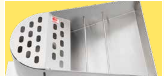
Automatischer Fülltrichter (optional) für bis zu 6 kg Füllkapazität