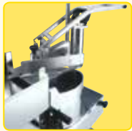
Fülltrichter mit Hebelbedienung

Mit einer großen Zubehörauswahl wird der TR260 zum idealen Partner für den Erfolg Ihrer größten kulinarischen Events.