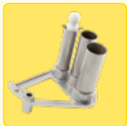
Stangengemüseröhren für Trichter mit Hebelbedienung