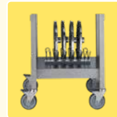
Fahrbares Edelstahl-Untergestell und Scheibenthalter (optional)