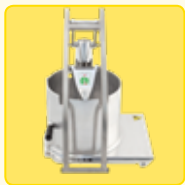
Kohlaufsatz zum Schneiden von Kohlköpfen im Ganzen (max. 250 mm) mit den Kohlschneidscheiben zu kombinieren