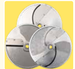
Große Scheibenauswahl (Ø 300 mm)