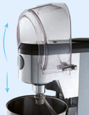
Ecran de sécurité associé au monte et baisse de cuve

* Eastman et Tritan sont des marques de Eastman Chemical Company