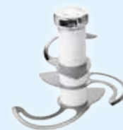
Mikroverzahnte Emulgiermesser K180