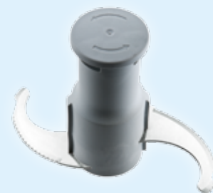
Rotor mit mikroverzahnten Emulgiermessern