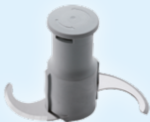
Rotor mit glatten Messern