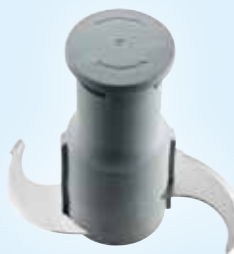
Rotor mit glatten Emulgiermessern