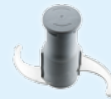
Mikroverzahnten & glatte Emulgiermesser K45-55-70