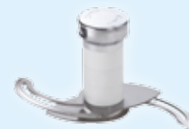
Mikroverzahnte Emulgiermesser K120