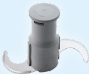
Rotor mit mikroverzahnten Messern