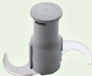
Con lame microdentate