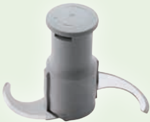
Con lame lisce

Scegliete il gruppo coltelli perfetto per la vostra preparazione.