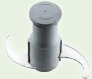
Con lame microdentate ideale per emulsioni