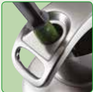
Einfülltrichter mit Stößel für Stangengemüse (Ø 55,5mm)