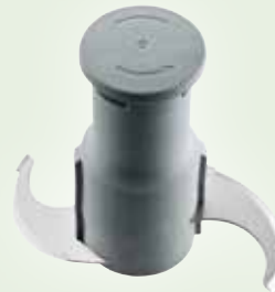
Rotor mit glatten Emulgiermessern