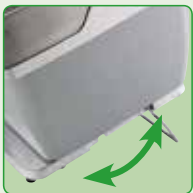
20° neigbare Basis für Gemüse- schneidfunktion