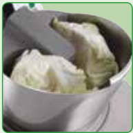
Runder Edelstahltrichter (215 cm 2 )

Variable Geschwindigkeit von 300 bis 880 UpM (Gemüseschneider) und bis zu 3.700 UpM (Kutter).