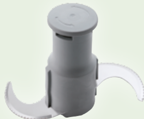
Rotor mit mikroverzahnten Messern