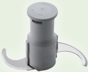
Rotor mit glatten Messern