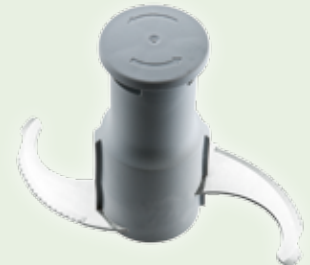
Rotor mit mikroverzahnten Emulgiermessern