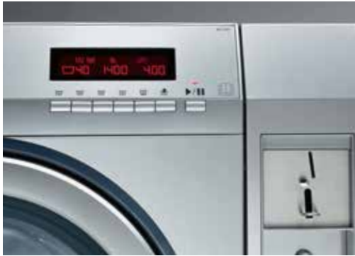
Perilice i sušilice rublja myPROZip s jednom kutijom za kovanice