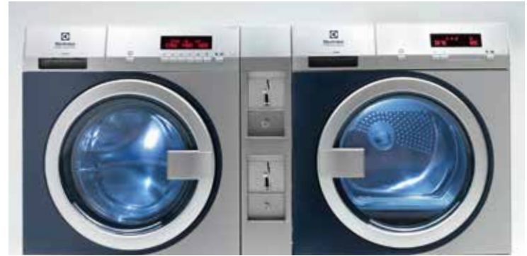
Perilice i sušilice rublja myPROZip s dvostrukom kutijom za kovanice