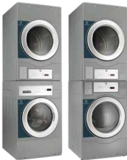
Perilica + Sušilica