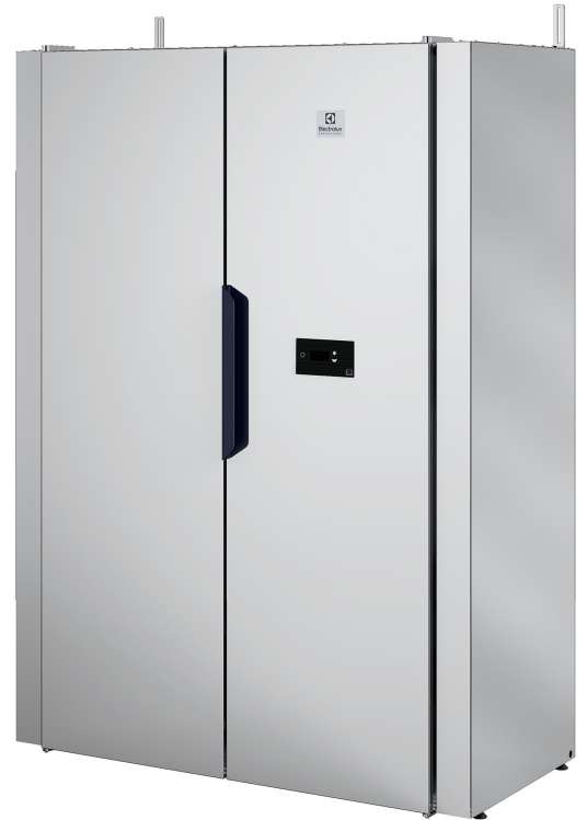
Bildene som vises, er bare en avbildning av produktet, og variasjoner kan forekomme.