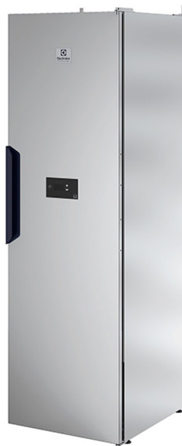
De bilder som visas avser endast beskriva produkten. Olika varianter förekommer.