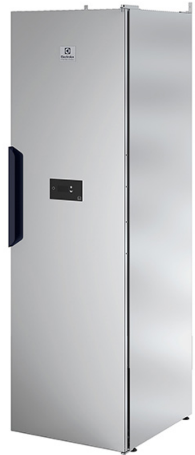
De viste billeder er udelukkende eksempler på produktet, og der kan forekomme variationer.