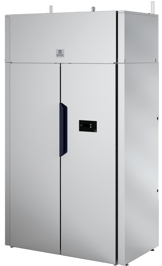
Bildene som vises, er bare en avbildning av produktet, og variasjoner kan forekomme.