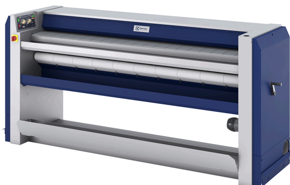
Bildene som vises, er bare en avbildning av produktet, og variasjoner kan forekomme.