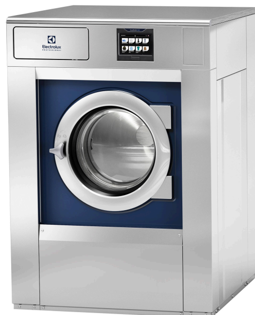
Le figure sono solo rappresentative; il prodotto effettivo potrebbe differire.

Pacchetto di programmi Global Advanced Hygiene 1 con un comprovato livello di abbattimento 6 log 11 per la disinfezione dei tessuti durante il processo di lavaggio in ottemperanza a tutte le normative locali