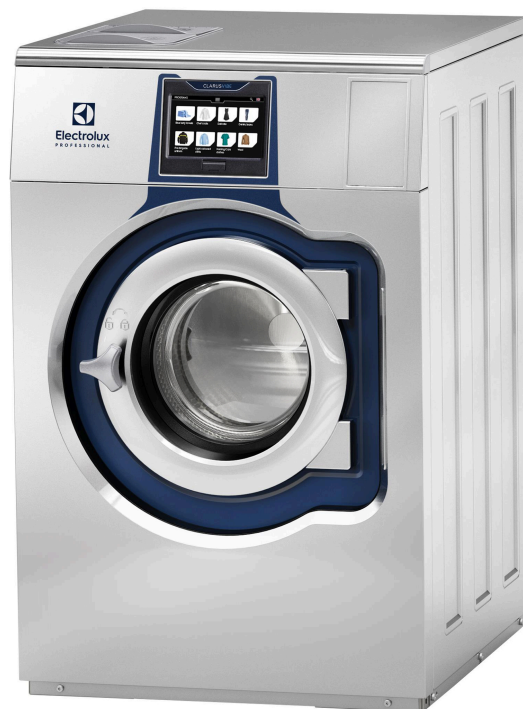
De viste billeder er udelukkende eksempler på produktet, og der kan forekomme variationer.

Global avanceret hygiejneprogrampakke 1 med dokumenteret log 6 reduktion II desinfektion af tekstiler via vaskeprocessen opfylder kriterierne for alle lokale, godkendte standarder