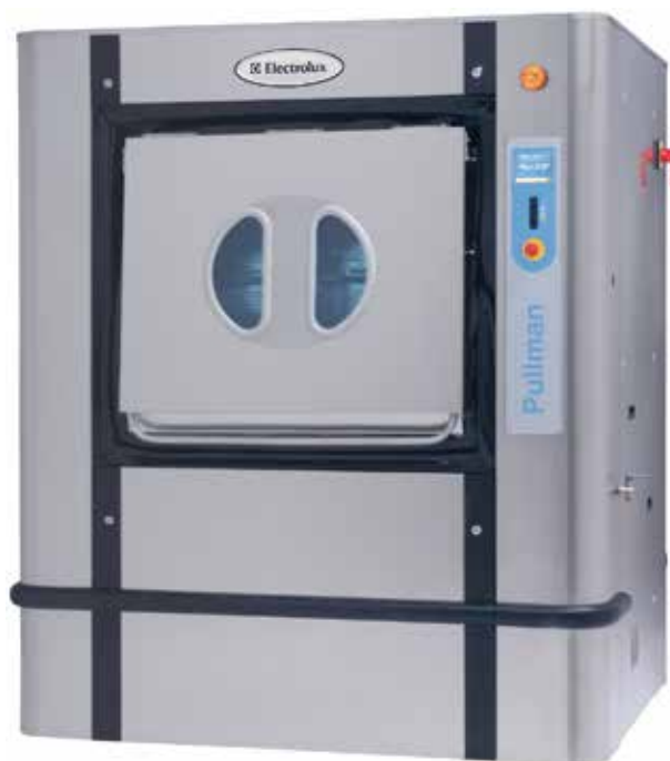
De bilder som visas avser endast beskrivna produkten. Olika varianter förekommer.