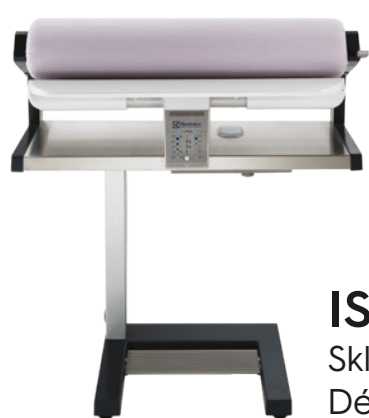
IS185 Skládací mandl Délka válce 85 cm