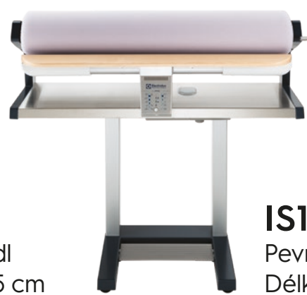
IS1103 Pevný mandl Délka válce 103 cm