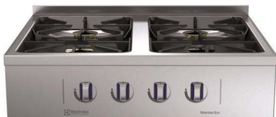
588524 Cucina a gas top, 4 fuochi, con alzatina (MBGGBBHOPO) posteriore - 1 lato operatore